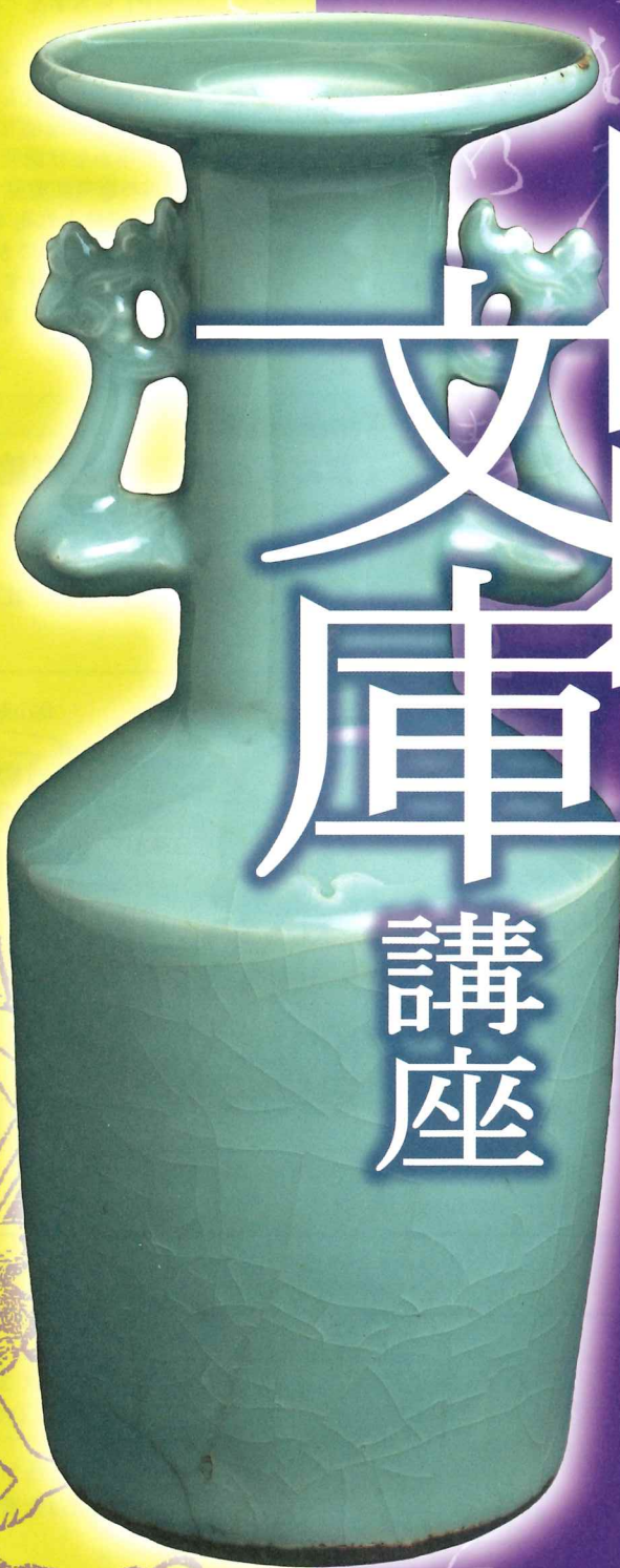
『青磁鳳凰耳花生 銘千聲』(陽明文庫所蔵)